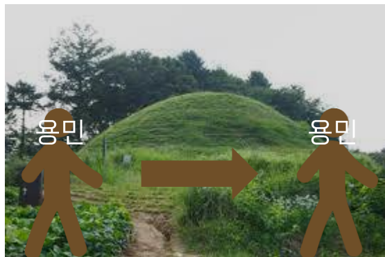
유곡리, 두락리 고분군