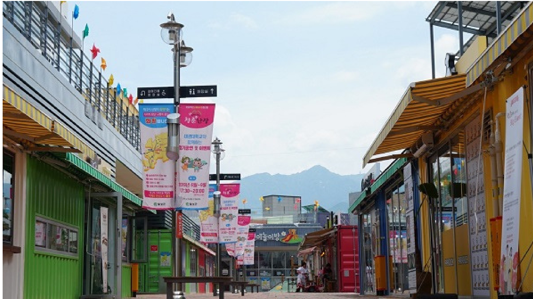
현풍시장의 여러곳을 다니며 여러 가게들을 보게된다 (master shot)