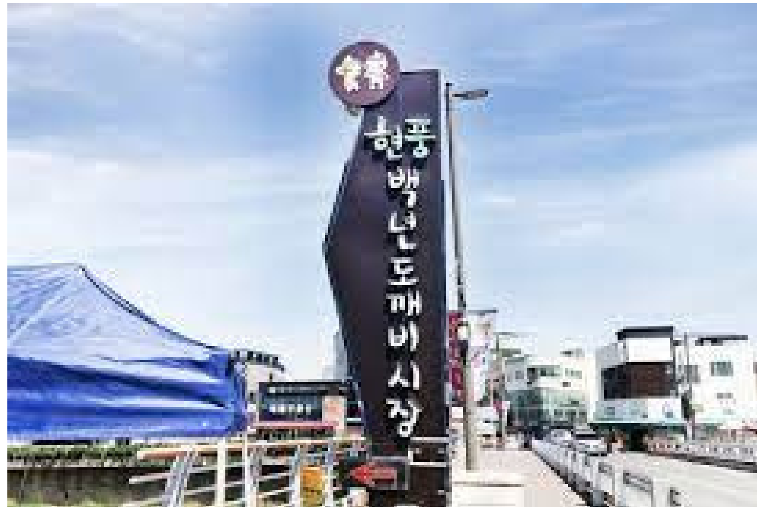
현풍백년도개비시장에 들어간다 (Full shot)